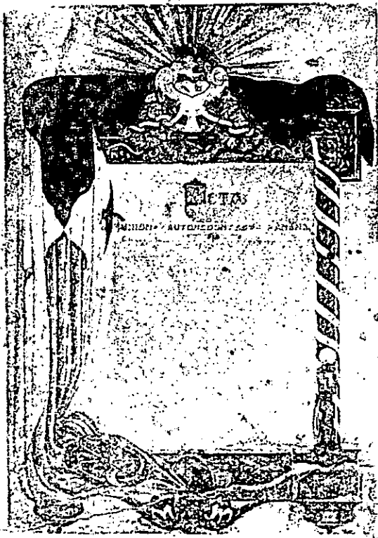
ACTA DE FUNDACION